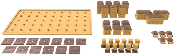
1.1 ehir planlama oyunu seti