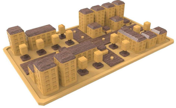
1.2 ehir planlama oyunu seti