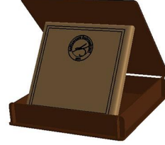
1.2 Plaket kutusu